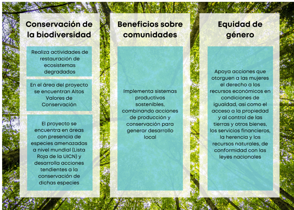
Ilustración 2. Requisitos de la categoría Palma de cera